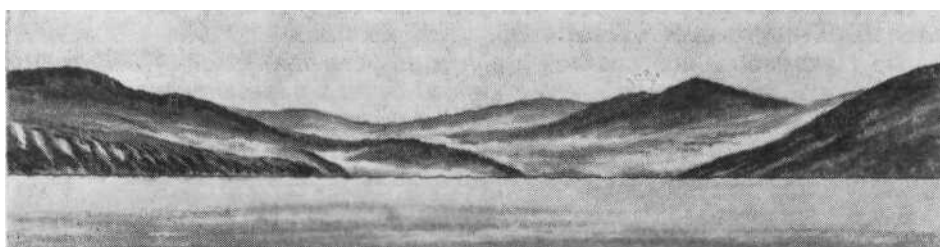
Бухта Прозрачная на 122° в 1 миле

40 Бухта Прозрачная находится в 2,8 кбт к S от бухты Отрада. Вход в бухту Прозрачная малоприметен. Берега ее у входных мысов высо-